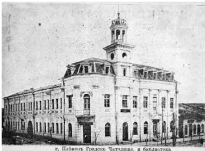
г. Пловдивъ Градско Читалище. и библиотека