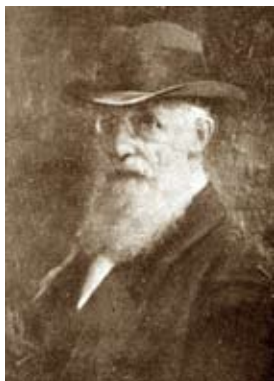
Иван Мърквичка Автопортрет