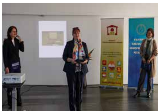
Годишна награда „Проф. д-р Ани Гергова“