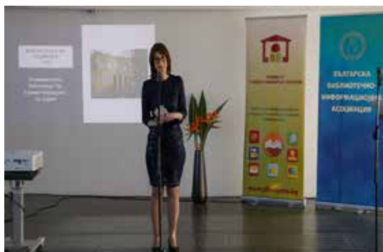
Категория „Библиотека на годината“ Университетска библиотека „Св. Климент Охридски“