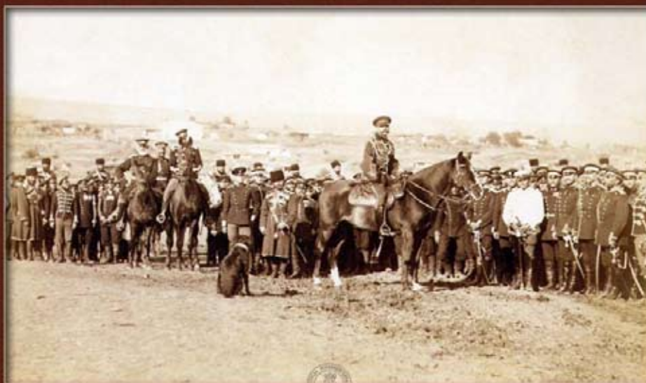
Негово величество император Александър II със своята гвардия по време на обсадата на Плевен, ноември 1877 г.