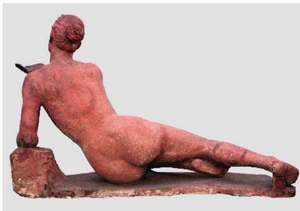
Голо тяло (Край извора), 1968 г., теракота, 87x140x70, подпис и дата на основата, отпред, вдясно: В. Емануилова 1968 IX, СГХГ, дарение от Васка Емануилова, инв. № 58, юбилейна изложба 1976 г.