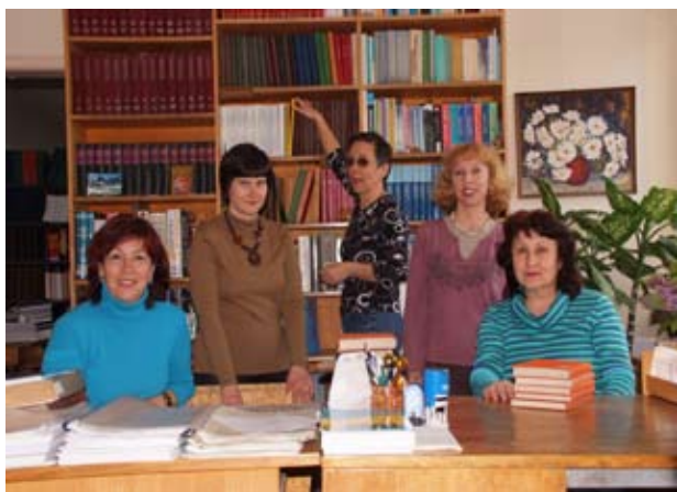
Екипът на библиотеката към Института по математика и информатика

фонд. Читалнята предлага удобни за работа места, свободен достъп до екземплярите на получаваната периодика от текущата година и дава възможност за ползване на част от богатия фонд справочни, енциклопедични и реферативни издания — общо 3030 тома. Всяка седмица за информация на читателите се подрежда изложба с новите постъпления.